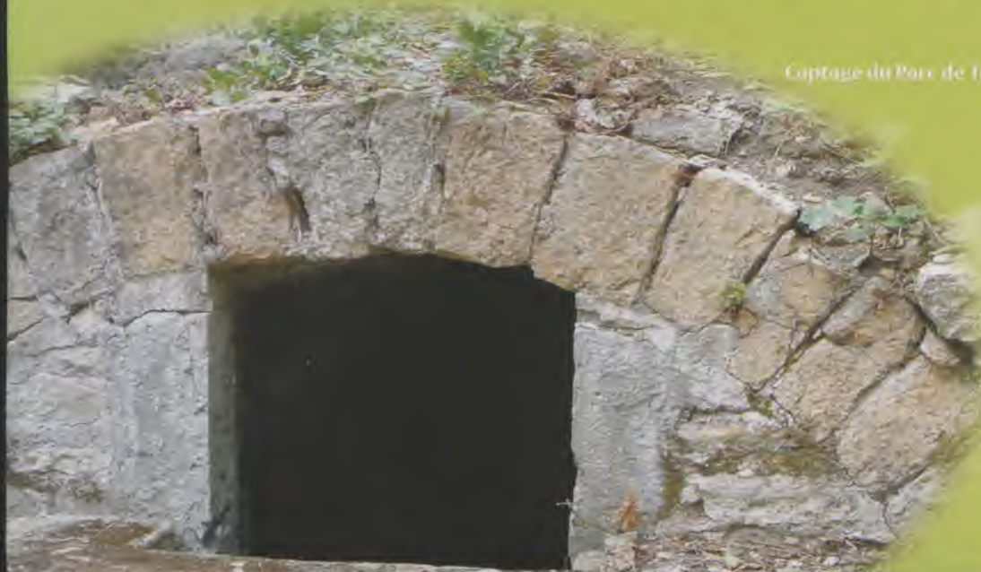
Captage du Parc de Louvevion