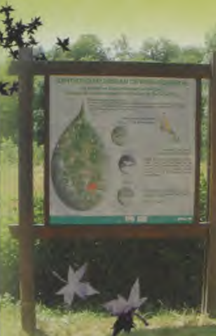
Sentier du ruisseau

Le sentier géologique, dans le cadre d'un partenariat avec ERASME (centre multimedia du Conseil Général du Rhône) a vu la première création d'une animation pédagogique interactive, consultable sur les sites www.montsdor.com ou www.laclassedor.com